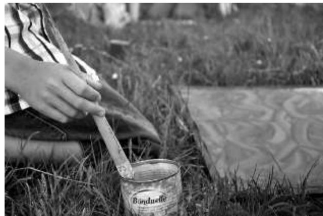
Algklassilaps projektipäeval maalimas.