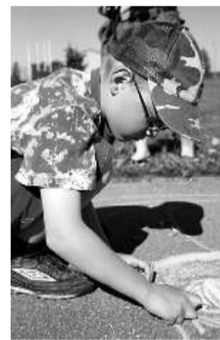
Algklasside õpilased joonistasid värviliste kriitidega rularajale.