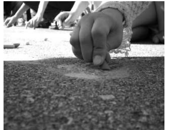
Algklassilaps projektipäeval joonistamas.