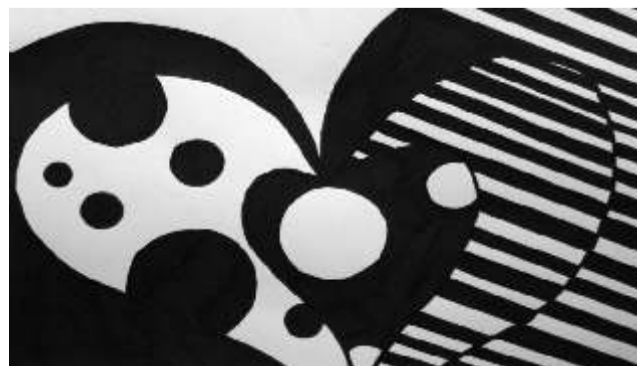
Op. kunst. Autor: Jürgen Elm