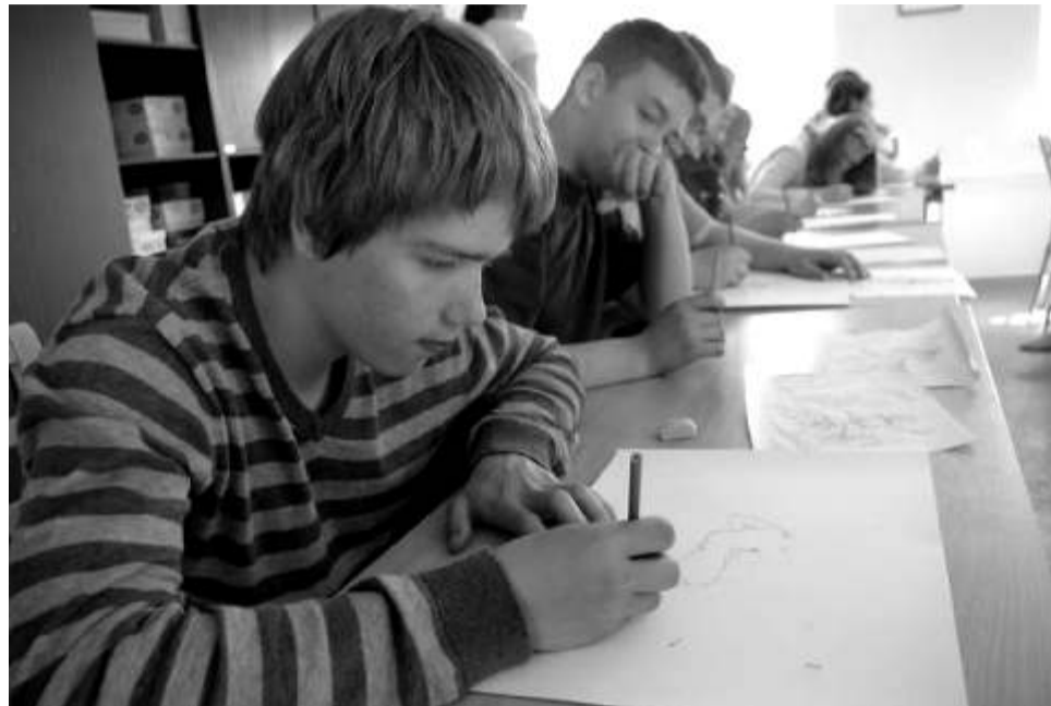
Seitsmenda klassi poisid õpetaja ausamba kavandit joonistamas.

Kui pikk kooliaasta seljataka, tarkused kogutud, teadmised omandatud, siis viimased koolipäevad on tavapärestest erinevad ning õpilased osalevad projektipäevadel, matkadel, teadmiste teatejooksus.