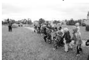
Väikesed jooksjad stardipaugu ootel.

Mina ja Kadilyn olime määratud ürituse pressiks. Pool tundi enne ürituse algust leidsime kaasõpilased võimlast. Minge aja pärast hakkasid kõik staadionile suunduma ja seda tegime meiega. Õpilased rivistusid klasside kaupa ja kui ka Võsu noored vastutuulest hoolimata hõisates ja joostes kohale jõudsid, võis üritus alata. Esmalt pidas direktor kõne, kus soovis kõigile palju jõudu, ja siis oli aeg eelmise aasta võitjal heisata