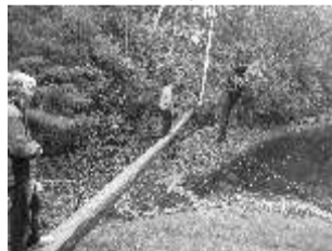
Õpilased panid oma tasakaalutunnetuse proovile.

Iga rühm alustas oma õuesõppepäeva erinevast suunast. Siinkõneleja „sabade“ rühm saadeti esmajoones õuematka koos Alutaguse matkajuhiga. Ning vihm ei olnud ikka