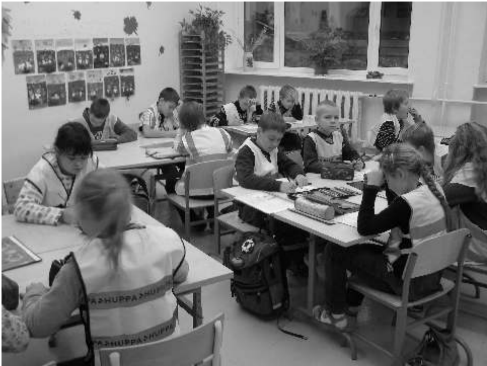
Algklassilapsed agaralt liiklusteemalisi mõtteid mölgutamas.

Juba esmaspäevast alates on algklassiõpilased olnud meeletatud liikluskasvatuse lainele. Agard on joonistanud oma unistuste autosid ja hoia-