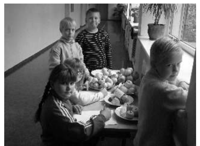
22. septembril tähistasid 2.a ja 2.b klass lõbusat õunapäeva.