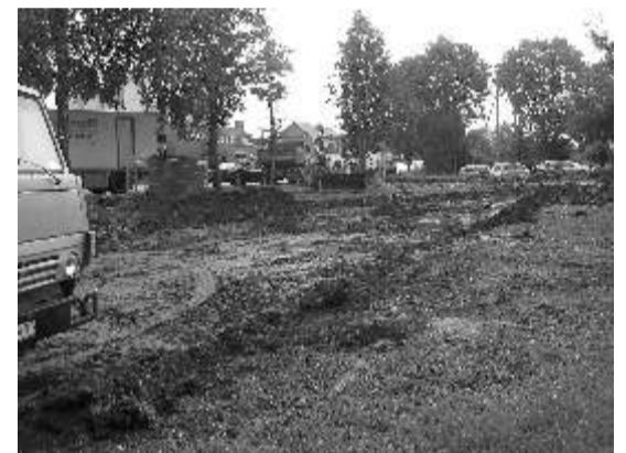
Kooli ümbrus 29.09.2011.