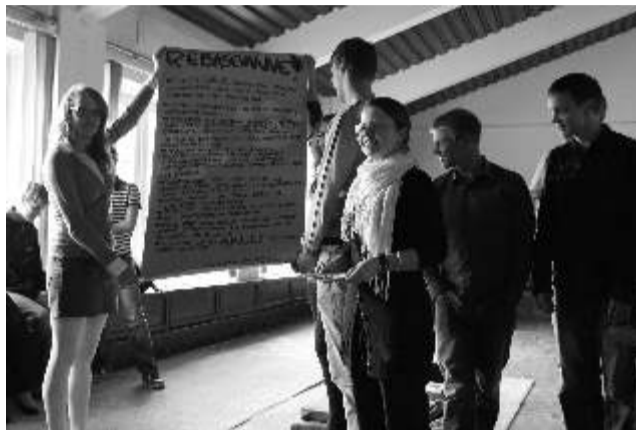
Rebasteid pidid kõva ja selge häälega ette lugema ka rebasevande.