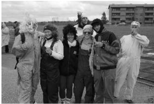
Viimastena lõpetanud kaheteistkümneid olid sooja tee üle väga õnnelikud.