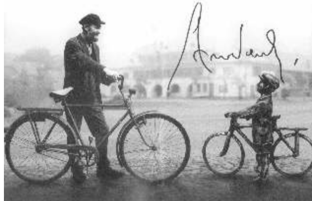
Arvo Pärt ja „Poiss jalgrattaga muusikat kuulamas.“