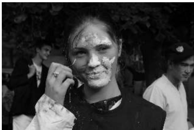
Peale kommiotsinguid võis rebaseid näha valgete nägudega.