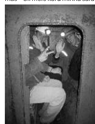
Rongisõidule mindi suurima rõõmuga.

Meie päev jätkus aga ka veel maa-aluse kaevanduse külastamise ning kehakinnitamisega. Kiiirid-lambid-kaevuririd-ded selga ning algas meie maa-alune ringkäik, kus räägiti erinevatest kivimitest ja maavaradest ning muidugi tegime ka väikese maa-aluse rongisõidu.