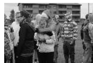
Kiire embus enne jooksu.